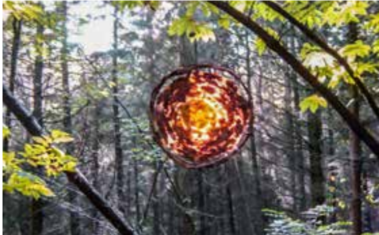
Georges Haibach Point du jour Lianes courbées liées avec de l'herbe, feuilles mortes piquées avec des épingles - Andlau, 2004