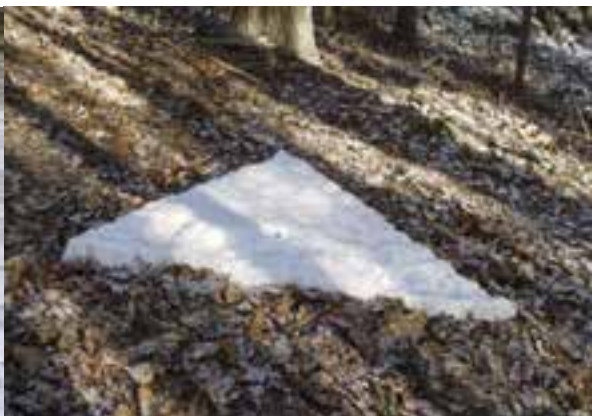
Jean Zugmeyer Triangles Branches, neige, feuilles - Andlau, 2009