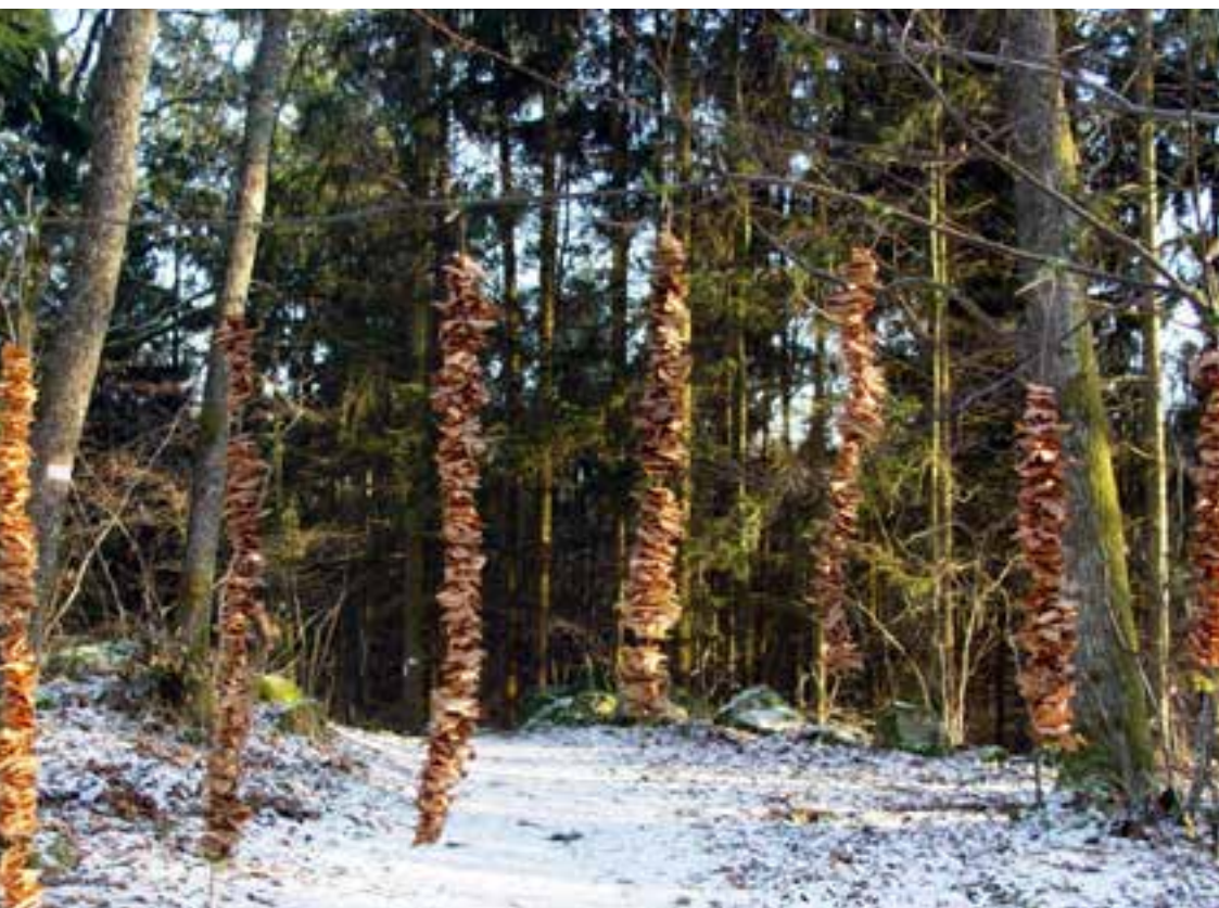
Marie-Cécile Girod Suspension Feuilles mortes - Andlau, 2009