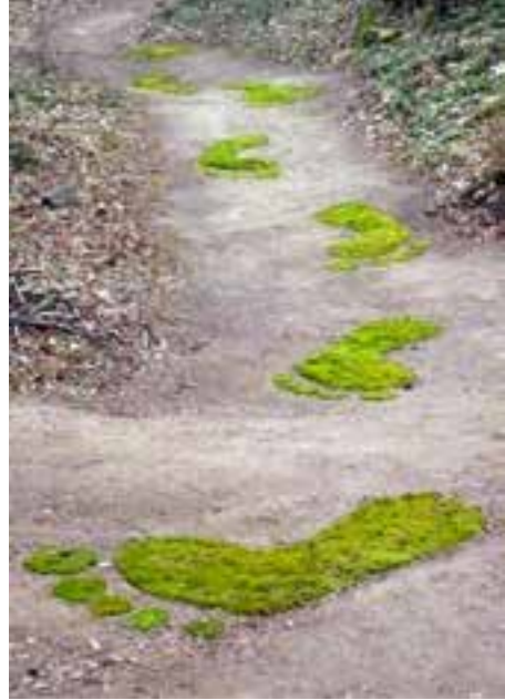
Jérôme Py Drôles de pas Mousse, pierre, bois, feuilles - Andlau, 2008