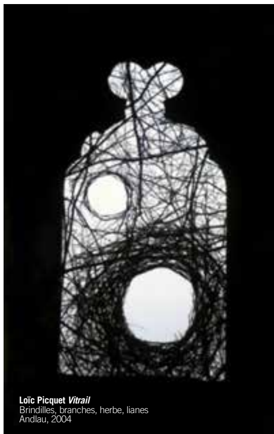
Loïc Picquet Vitrail Brindilles, branches, herbe, jianes Andlau, 2004

Et malgré la volonté et la puissance technologique actuelle qui diffère ou relègue la main, il est bon de comprendre que Surface, volume, densité, pesanteur ne sont pas des phénomènes optiques. C'est entre les doigts, c'est au creux des paumes que l'homme les connut d'abord. L'espace, il le mesure du pas, non du regard, mais de sa main et de son pas. Le toucher emplit la nature de forces mystérieuses. Sans lui elle restait pareille aux délicieux paysages de la chambre noire, légers, plats et chimériques 24 .