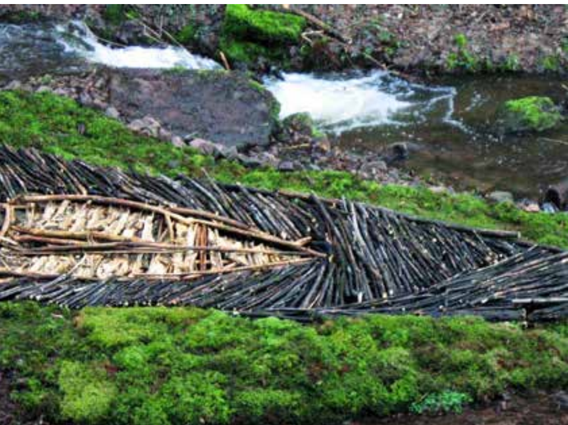
Sophie Bussler Île de bois Branches brutes, branches écorcées, mousse - Nideck, 2007