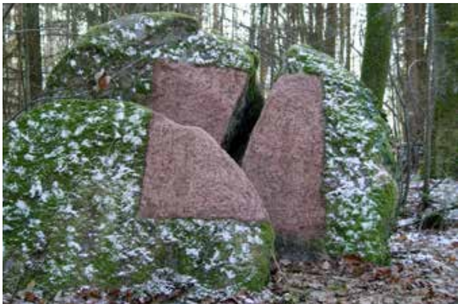
Aurore Priolet Carré Mousse, sable sur rochers - Andlau, 2009