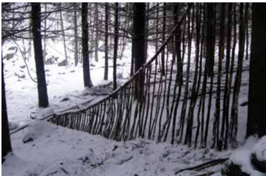
Sébastien Hippert Les «sous-lignes» Branches coupées, posée sur des troncs existants - Andlau, 2006