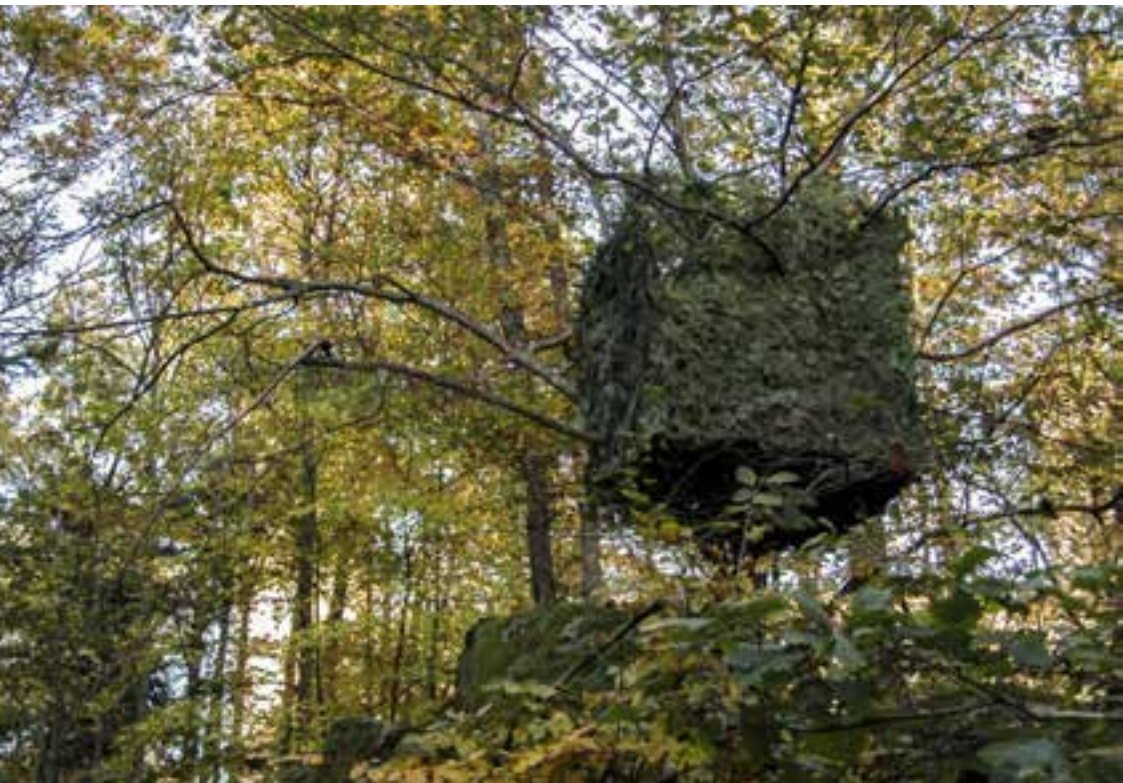
Jean-Charles Riber Cube Branches de sapin - Andlau 2003